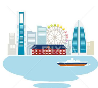
pixta.jp - 20991032